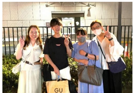
学校の吹奏楽の本番終わり

そのソロは自分の大好きなメロ ディーでもあり、本番で吹けた ことは本当に素晴らしい経験で した。仲間と演奏できたのも自 分の中で心に残っている幸せな 思い出です。