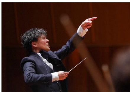
2024年12月1日定期