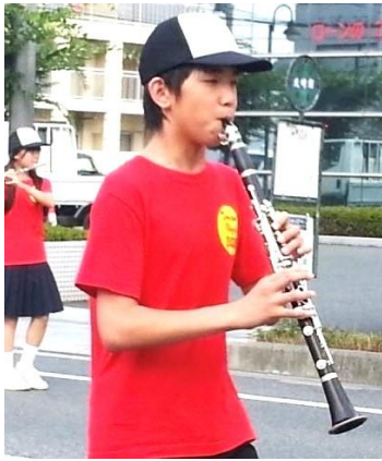
中学校2年生 吹奏楽部 マーチングの本番

きという気持ちもありました が、音楽の道に進みたいなどい う気持ちもずっとあったので、 部活の時間が第一という感じで した。ちなみに、小学校の頃はピ アニストになって全国を回る 『旅するピアニスト』に憧れた り、中学校の時には吹奏楽団で クラリネットのソロになりたい と思っていました。