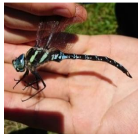
オオルリボシヤンマ

も、捕虫網は常に車中に置き、北海道の広い野山で網を振り回してトンボを追っている瞬間は、今思い返しても心が踊るようです。唯一の経験しなかったことといえば、あれだけ道内を走り回っても一度もヒグマの姿を見なかった事です。