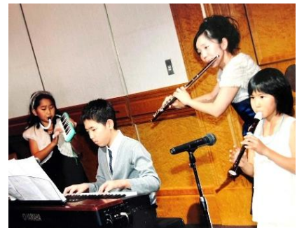
↓ 小学校5年生 叔母の結婚式で

で、入った時は嬉しかったです。地区大会で銀賞の弱小の部だったのですが、自分の好きなように練習ができたので、それもよかったです。