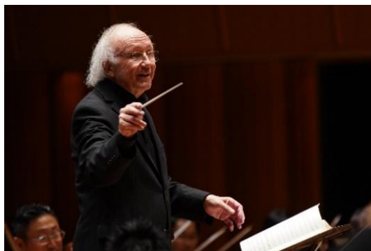
ハインツ・ホリガー

この交響曲は、シューベルトの亡くなる年に書かれたと長年思われていたが、自筆譜表紙の読み間違えであることが検証されたのが、わずか30年ほど前のことである。当時、シューベルトは歌曲の作曲家として名を知られていたが、交響曲や室内楽曲の作曲家としては、ほとんど知られていなかった。そのため「未完成交響曲」も含め、演奏されず埋もれてしまった作品が多い。この曲も作曲家は音として聞いていなかった。シューベルトの死後、彼の墓参りに訪れたシューマンが、遺品から偶然この曲のスコアを発見し、メンデルスゾーンによって初演された。ベートーヴェンの第9交響曲に憧れを抱いて作曲されたというこの曲をシューマンは「至るところに深い意義があり、一音一音が鋭利を極めた表現を持ち、深いロマン性まきまきとされている」と評したように、まさに「グレイト」な交響曲なのだ。