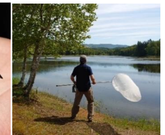
士別のキャンプ場にて