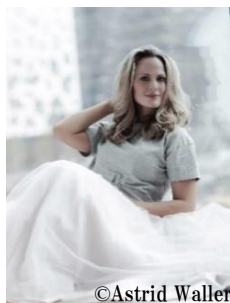
マリ・エリクスモーエン

この曲は第1番から6年後に発表されたが、前作同様素朴な抒情性、線の対位法、民謡風な旋律の使用などマラーの特徴を内包してはいるが、さらに野心的で意欲に満ちたものとなっている。その最大の聴きどころは、やはりクロープシュトックの「復活」の讃歌であろう。マラーが強く影響を受けたビュローの葬儀で、「復活」の合唱が響き、